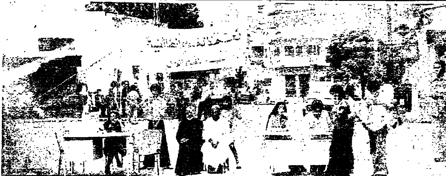
جلوس تحت لافتة « نعم للامم المتحدة »